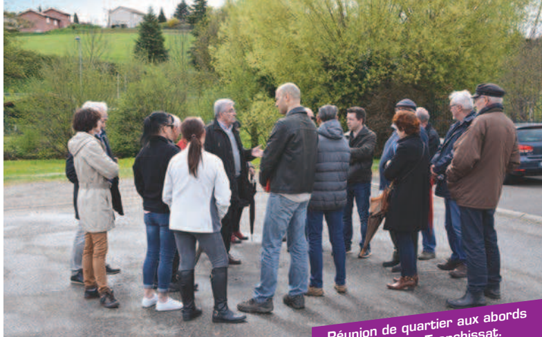
Réunion de quartier aux abords du lotissement Tranchissat.