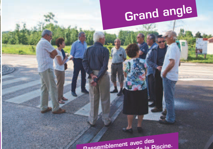
Rassemblement avec des riverains de la rue de la Piscine.